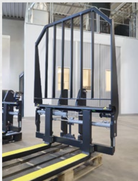
C25 med laststöd och Croc® gaffelbeläggning

Utöver vårt standardsortiment har vi stor erfarenhet av att utveckla kundanpassade lösningar för unika applikationer. Våra integrerade gaffelspridningsaggregat passar de flesta truckar på den europeiska marknaden. De kan även levereras i påhängsutförande för ISO-upphängning, OQT-fästen eller andra typer av maskinfästen. Ett brett utbud av tillval gör det möjligt att ytterligare anpassa aggregatet efter just din applikation.