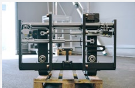
C35 med SmartFork® SideCam