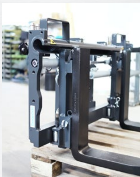
C25 med CarryAll™ (manuellt snabbfäste)