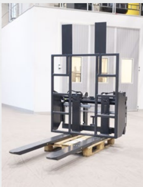
C35 med laststöd och KOOI® ReachForks